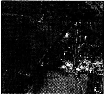
LOC. SIN ESCALA